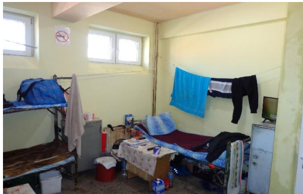
Спално помещение (Килия)

Килиите на настанените лица имат осигурен достъп до светлина. Дограмата е подменена във всички помещения, които проверяващият екип обиколи.