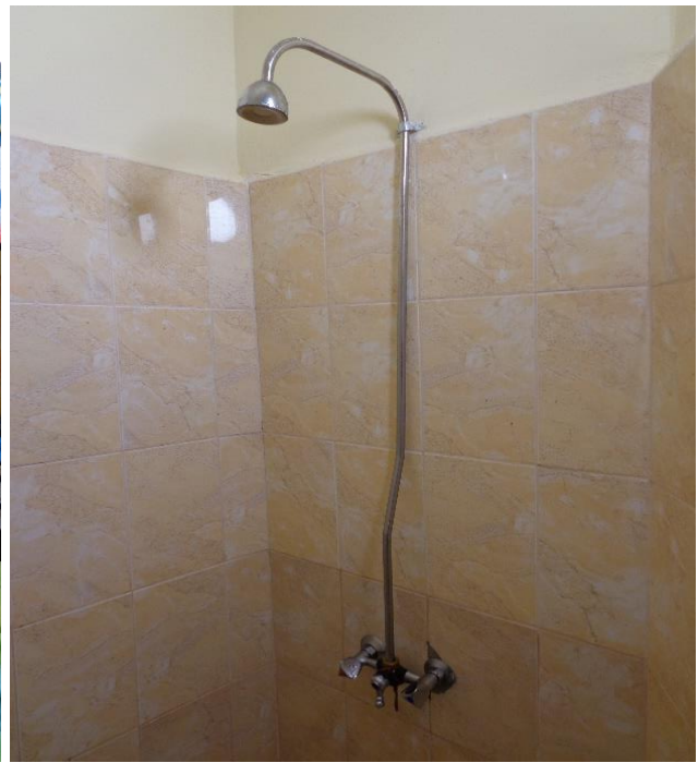
Килия и санитарно помещение

Общежитието разполага и с перално помещение, където се извършва прането и сушенето на дрехите на лишените от свобода, по график.