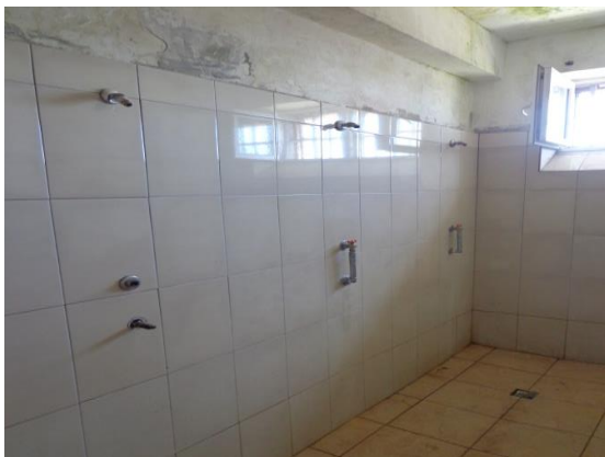
Баня с теч и влага на тавана

В тази връзка, следва да бъдат предприети спешни мерки за отстраняване на проблема чрез извършване на съответните ремонтни дейности в засегнатите помещения.