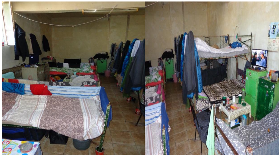
Спалните помещения в ЗООТ „Житарово“

В тази връзка, омбудсманът в качеството си на НПМ препоръчва да бъдат предприети спешни мерки по извеждане на част от лишените от свобода в другите налични спални помещения, с което да се отговори на европейските изисквания за жилищна площ от 4 кв.м.