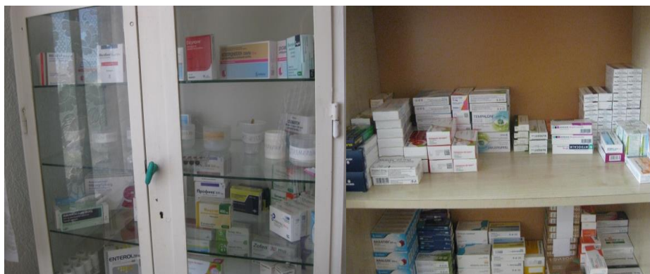
Спешен шкаф и лекарства за лишените от свобода

Медицинското обслужване се извършва от медицинския фелдшер на Затвора – гр. Бургас, който посещава затворническото общежитие по график, един път седмично. Стриктно се води задължителната медицинска документация. Спешният шкаф и шкафове за лекарствени продукти са заредени, като продуктите и консумативите са в срок на годност. Лекарствата се раздават на лишените от свобода срещу подпис.