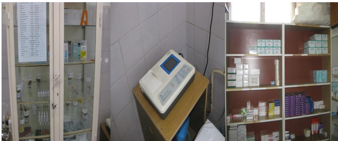
Спешен шкаф, оборудване и лекарства в МЦ

Медицинският фелдшер е организиран работата си в съответствие с нормативните изисквания и съгласно работния си график, задължителната медицинска документация беше изискана и проверена, като е констатирано, че е изключително пълна и се води редовно. В извънработното време на медицинския център, спешните случаи се поемат от екипи на ЦСМП – Бургас, които винаги се отзовават своевременно. Спешният шкаф и шкафове за лекарствени продукти са добре заредени, като лекарствата и консумативите са в срок на годност.