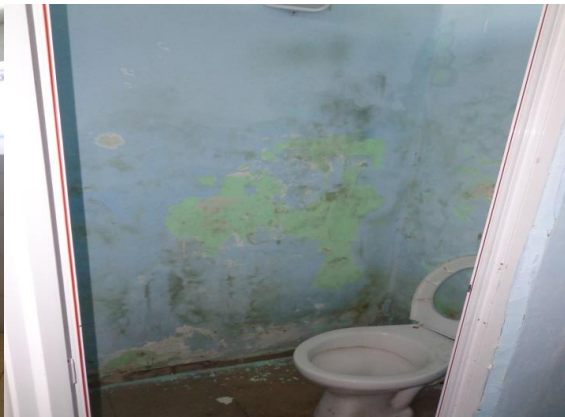
Санитарно помещение с влага по стената