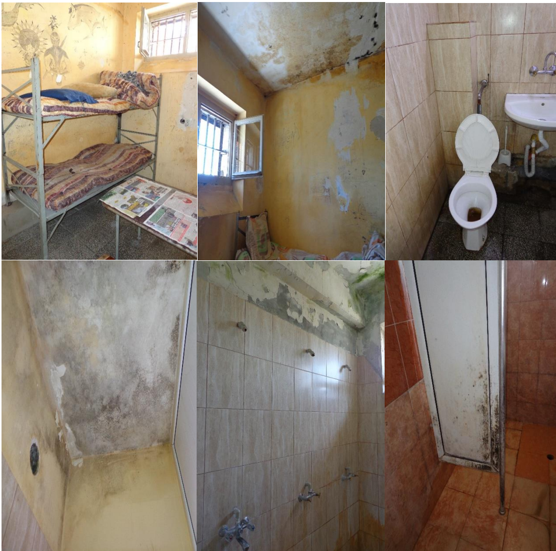
Килии, бани и тоалетни в ареста

В следствие на извършената проверка екипът на НПМ констатира, че арестните помещения се нуждаят от спешни ремонтни дейности, тъй като са в лошо състояние, с мухъл и влага по стените в килиите, сервизните помещения и баните.