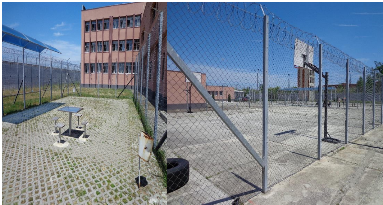
Площадката за престой на открито

След приключване на ремонта на ЗООТ „Строител“, в освободения корпус ще се настанят лишените от свобода от ЗООТ „Дебелт 1“, а освободеният от тях етаж ще бъде използван, за да се разшири капацитета за настаняване на лишените от свобода от закрит тип.