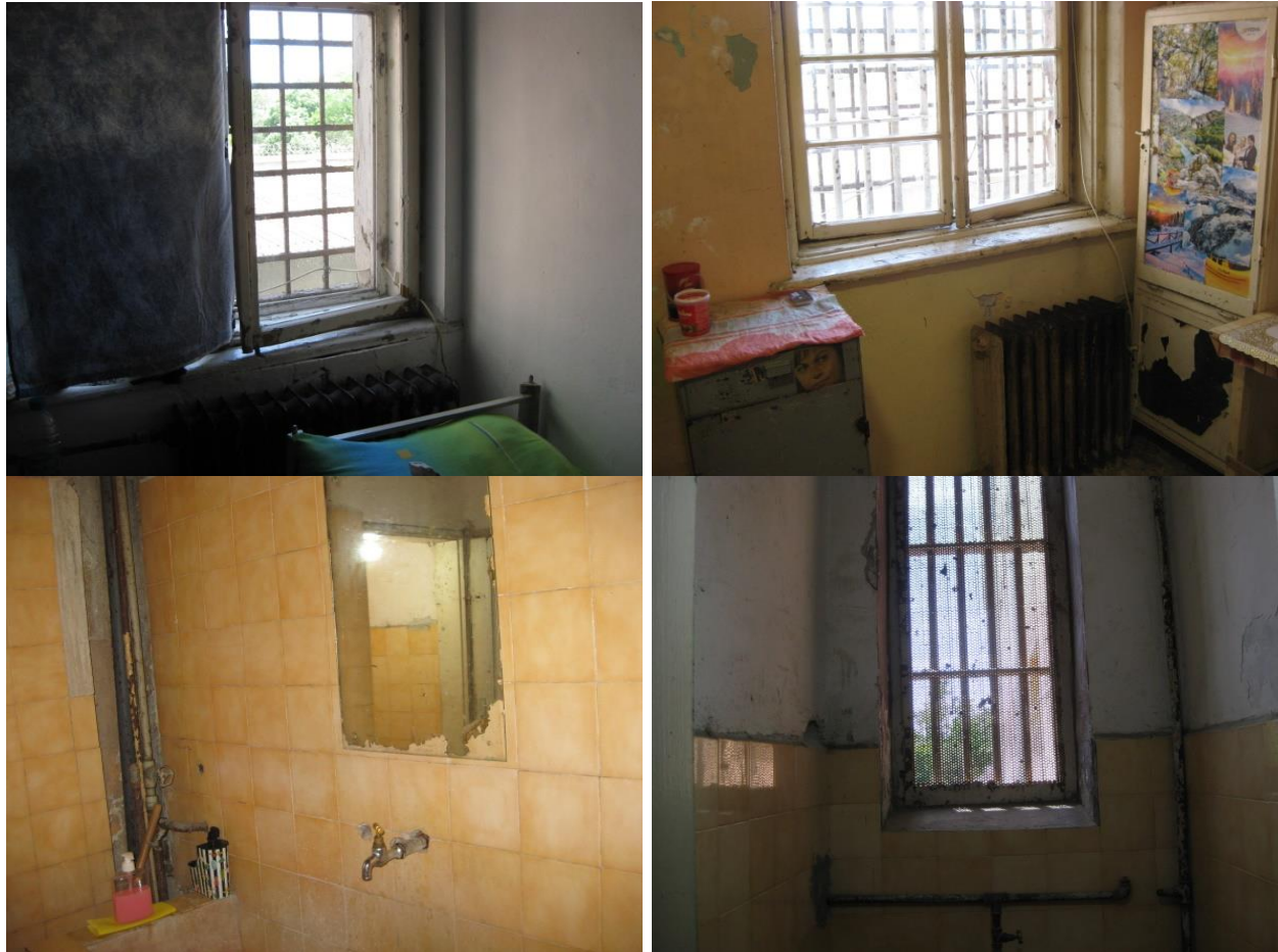
Стационар и санитарни помещения в МЦ

При проведените разговори със задържаните и лишените от свобода оплакванията са основно от отношението към тях, както и от затруднен достъп до лекарска – първична и специализирана, както и болнична медицинска помощ.