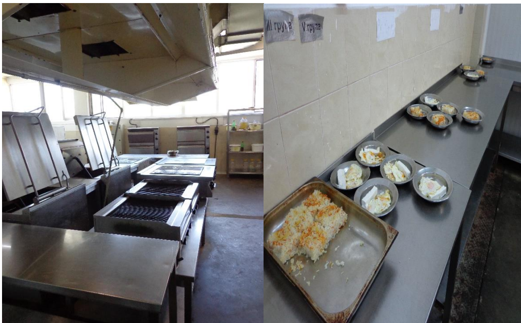
Кухненско помещение с нови уреди

На разположение на лишените от свобода има и лавка, от която могат допълнително да си закупуват продукти според нуждите им.